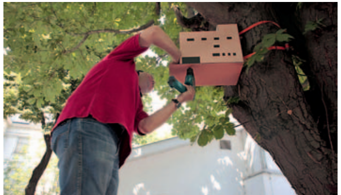
Alexandra Curti: Loos Montage