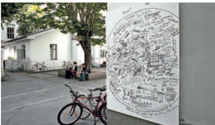
Mario Volenski: Graffiti