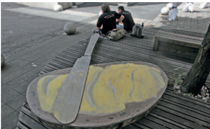
Dominik Szere day: Butterbrot