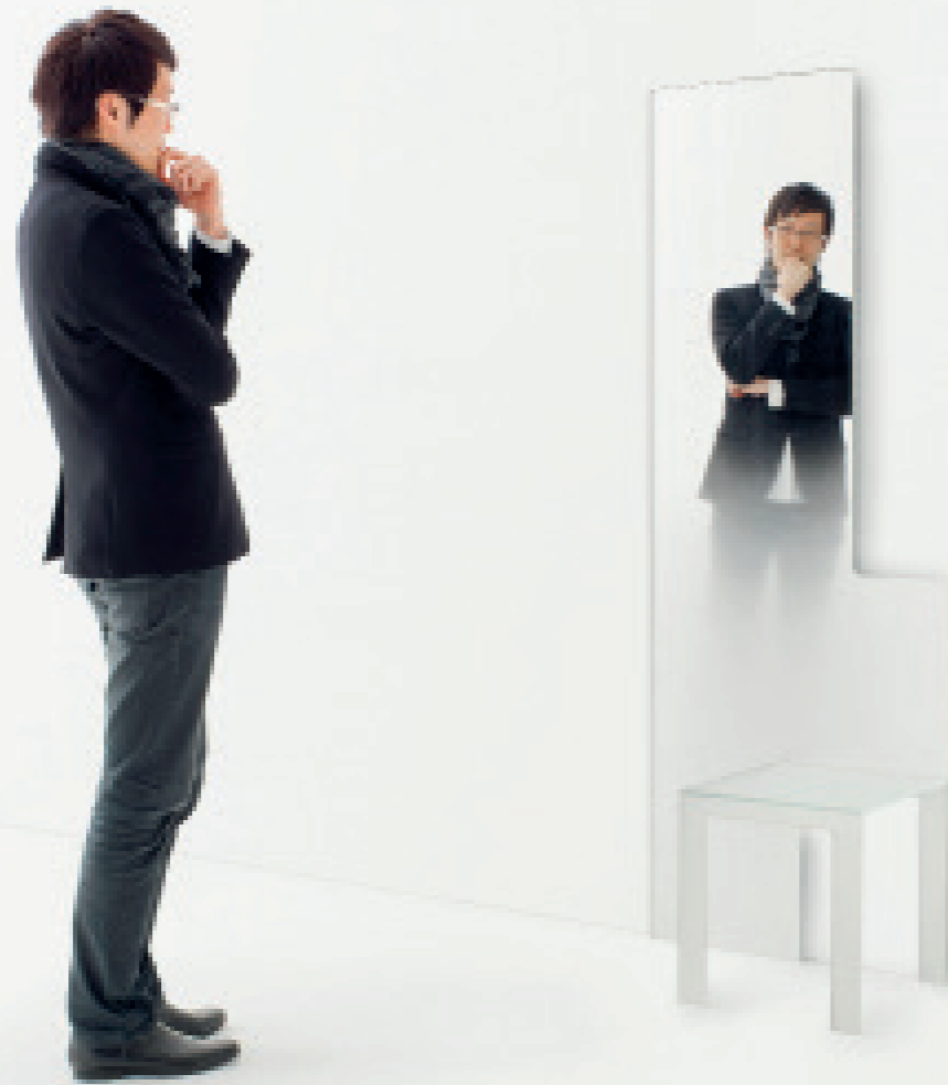
Aus einem Stück: Mirror Chair von Designer Oki Sato (Nendo)