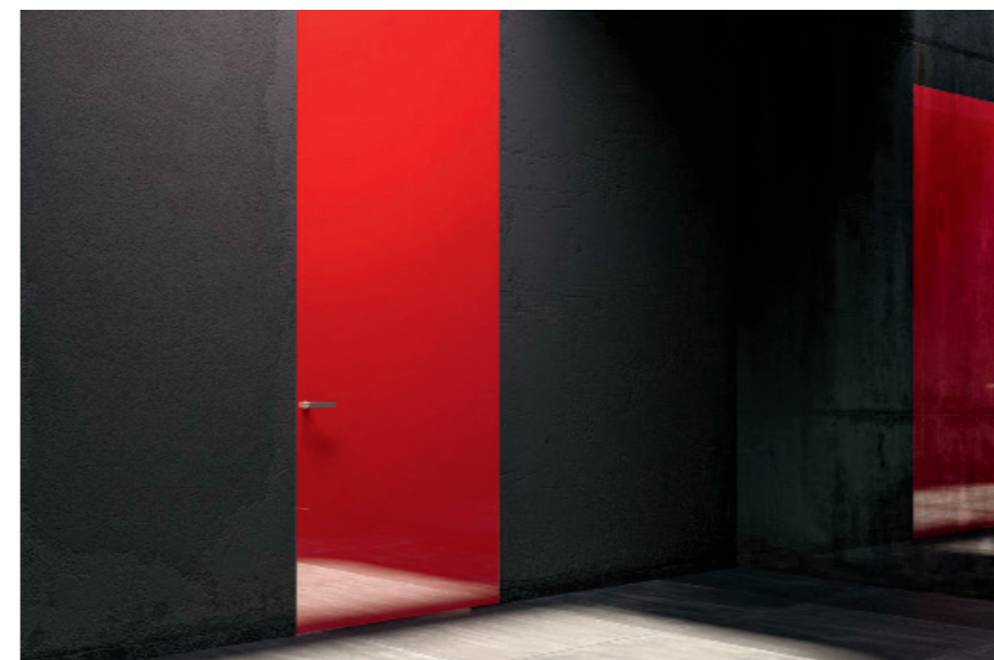
Flächenbündige Schwenktür Infinto aus Alu-Rahmen mit eingesetztem Glas in verschiedenen Farben.

reservierte Zonen hinter Glas ersetzt das charmante Weiterbitten ohne abzuweisen, und die Oberflächengestaltung spricht – geätzt, satiniert, eingefärbt, spiegelnd, durchsichtig – Bände. So sehr hightech Glas auch in Zukunft noch werden mag, das Gefühl, das ein paar Millimeter erzeugen können, bleibt unnachahmlich.