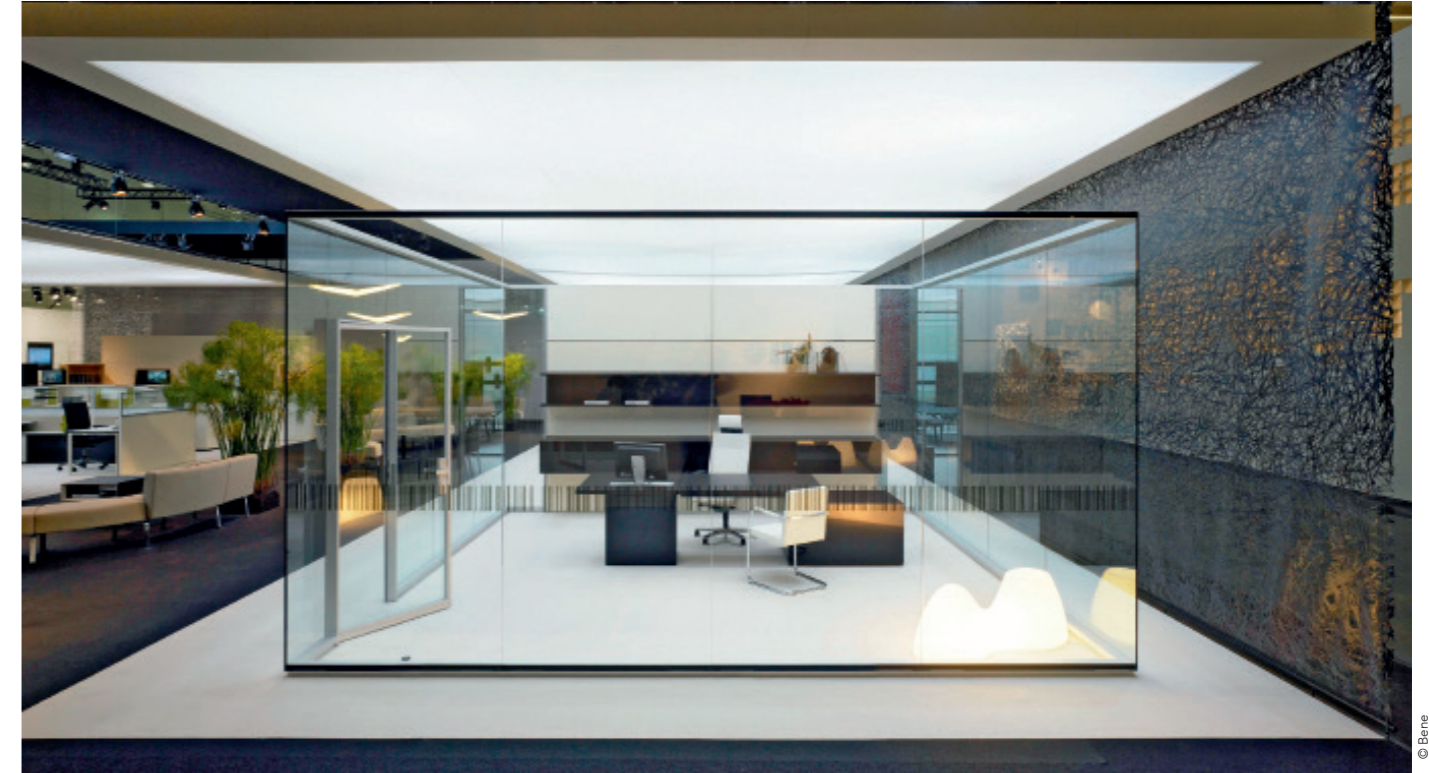
Maximale Transparenz: Glas-trennwandsystem RF-Flurwand ein- oder zweischalig.