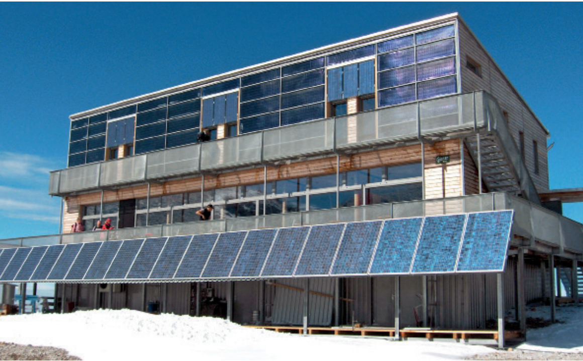
Schiestl Haus, Trebersburg und Partner Architekten. Aus Trebersburg, M., Hofbauer, W.: Passivhaus auf +2154 M. In: Drabarczyk, L. (Hrsg.): XIA Intelligente Architektur 04/06. Leinfelden-Echterdingen, 2006, S. 22-29.