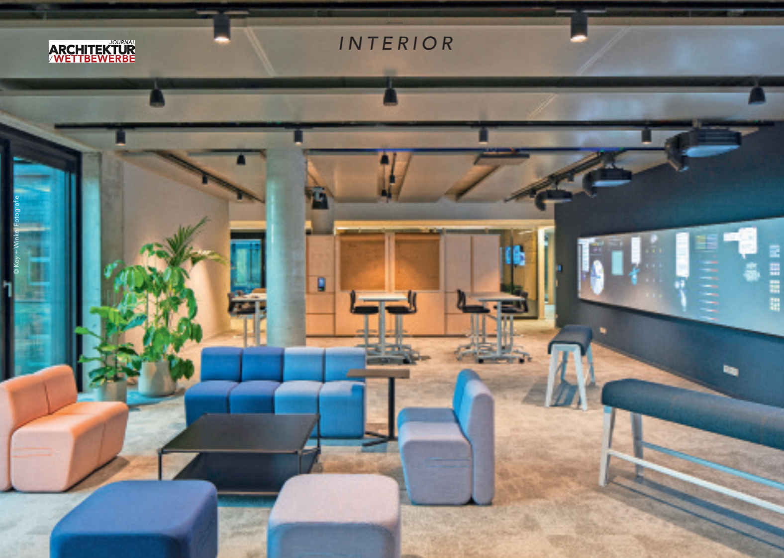
Eine Vielzahl an Lounges erweitert die Möglichkeiten, wie und wo gearbeitet werden kann.