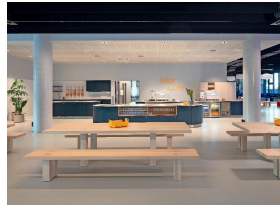
toi toi toi creative studio

„BEI UNSEREM DESIGN GING ES NIE DARUM, INS BÜRO ZU GEHEN UND DAS GEFÜHL ZU HABEN, DASS MAN ‚IM BÜRO‘ IST. WIR WOLLTEN, DASS SICH ALLES GROSSZÜGIG ANFÜHLT UND DEN KOMFORT VON ZU HAUSE HAT.“