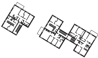
Grundriss Obergeschoß (Ausschnitt)