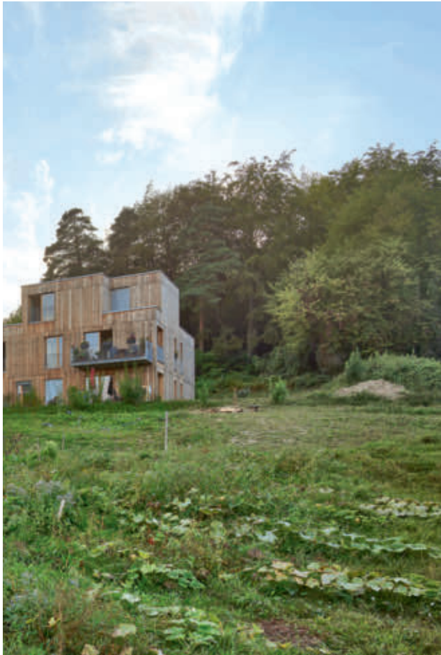
Das neue Dorf besteht aus zehn zwei- und dreigeschoßigen Wohngebäuden.