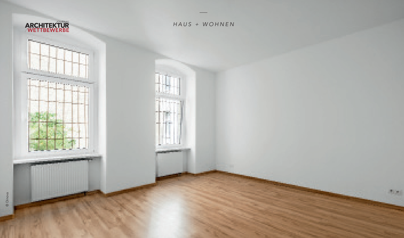
Weiß symbolisiert Ordnung und Unschuld. Weiße Wände bieten einen neutralen Hintergrund.