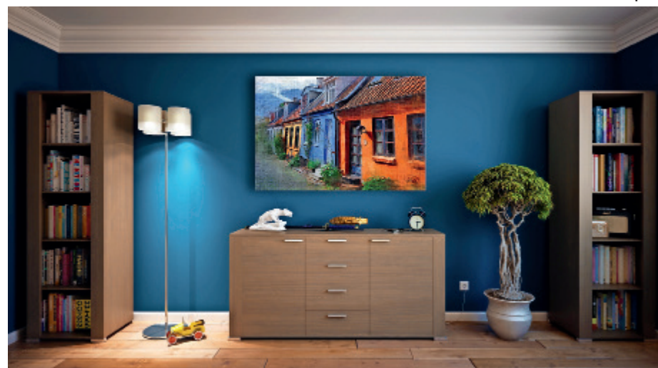
Blau steht für Entspannung, kann aber auch emotionslos wirken.

von Rot. Es stimuliert sowohl den Körper als auch den Geist und vermittelt Ausgelassenheit, Freude, Vitalität, Fröhlichkeit, Spaß, Sinnlichkeit, Sicherheit und Wärme. Zu dunkel wirkt es braun, zu hell wirkt es süßlich. Ist die Mischung falsch, kann Orange aufdringlich wirken.