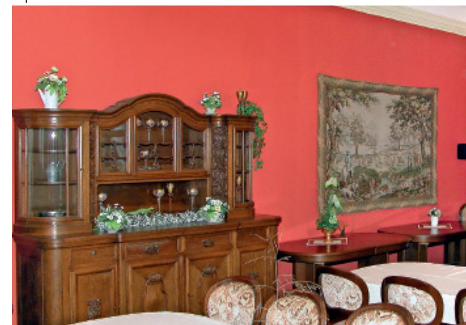
Ein gedämpftes Grün vermittelt Harmonie (oben). Rot wirkt anregend, kann aber schnell zu viel werden. Gelb und orange stimulieren den Geist, können aber auch aufdringlich wirken (ganz unten).